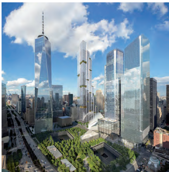
El espacio donde la nueva construcción completará el paisaje.

Se dieron a conocer nuevos renders para el rascacielos Two World Trade Center que se construirá junto al One World Trade Center, informó New York Yimby. Este nuevo edificio es un proyecto de Visualhouse diseñado