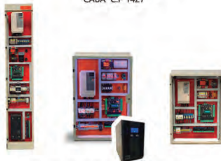
CONTROLES DE MANIOBRAS

114554-0331 114552-2547 Asistencia Técnica +54 11 3142-9068