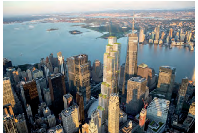
Vista aérea de Nueva York.