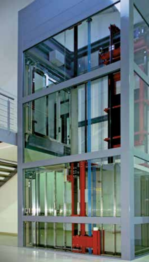
Firmengebäude, Pliening bei München, Deutschland, Typ: ONYX