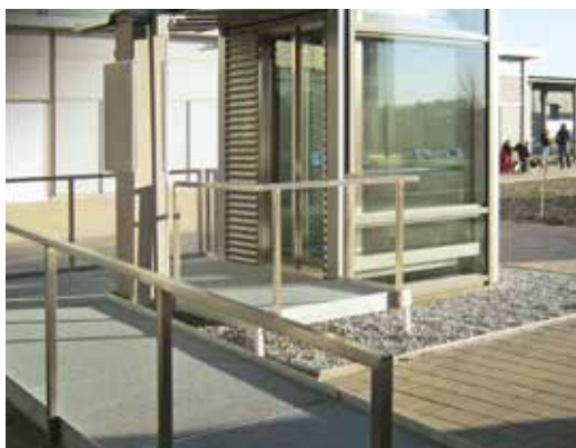
Aussenanlage mit Rampe, Deutschland Typ: JADE