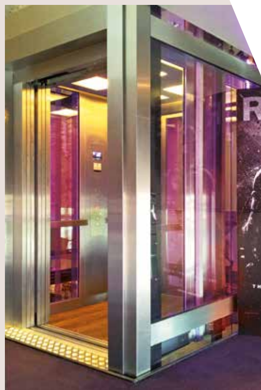
Hoofddorp Kino, Niederlande, Typ: EMERALD

TITELSEITE: Icon Tower, Oslo, Norwegen, Project of the year 2013, Typ: JADE