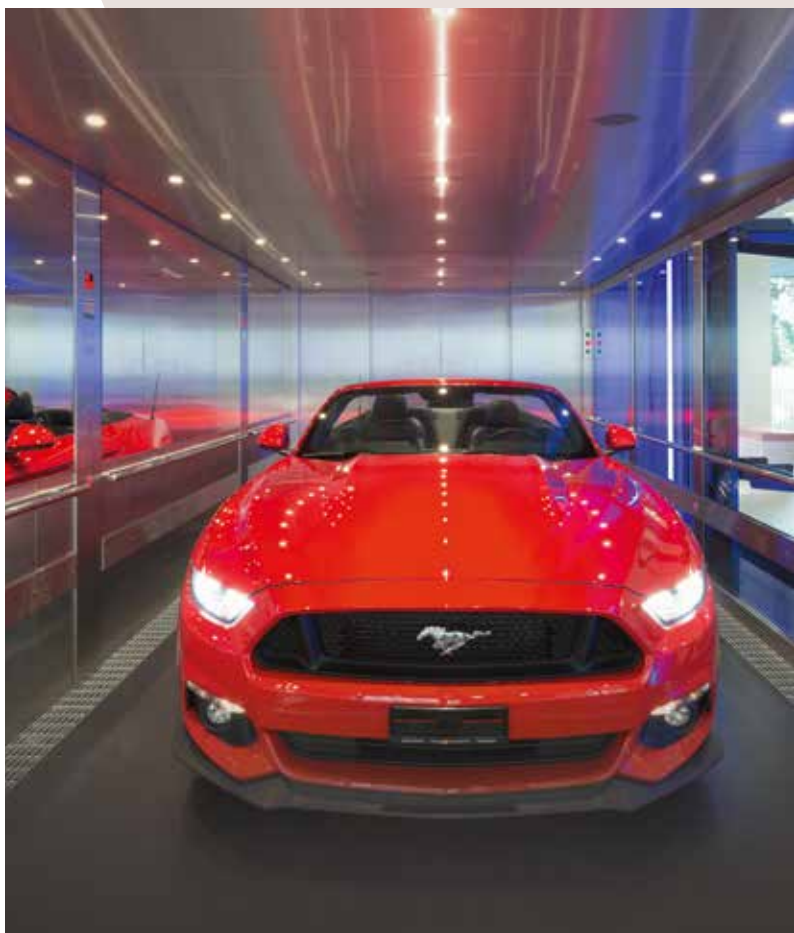
Autohaus, Schweiz Typ: Hydraulik mit Glas