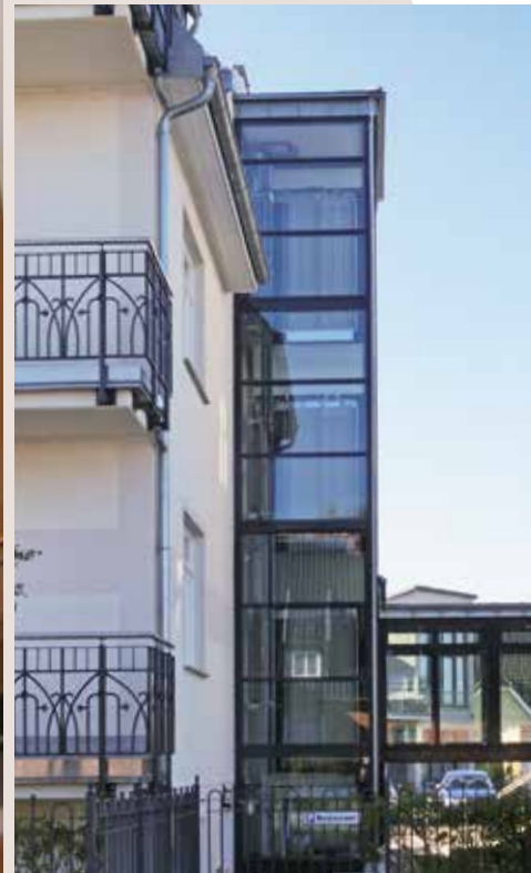
Leiner Shopping Center, Innsbruck, Österreich, Typ: EMERALD