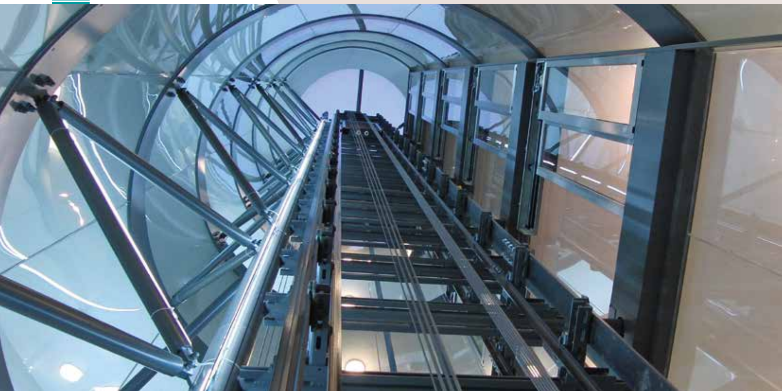
Ceramique, Maastricht, Niederlande, Typ: JADE